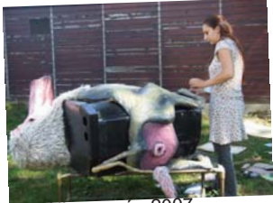
Ophélie.. cuvée 2007 Les stagiaires de Conte en Creuse...

Clefs des gîtes autour du cou, planning des arrivées / départs de tous les trains d'Eymoutiers Gare et du Festival en tête, liste à rallonge des courses, le téléphone toujours à proximité pour toute urgence : La Baroudeuse du Festival c'est FRAMBOISE !!