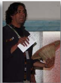
Victor faisait la manche...